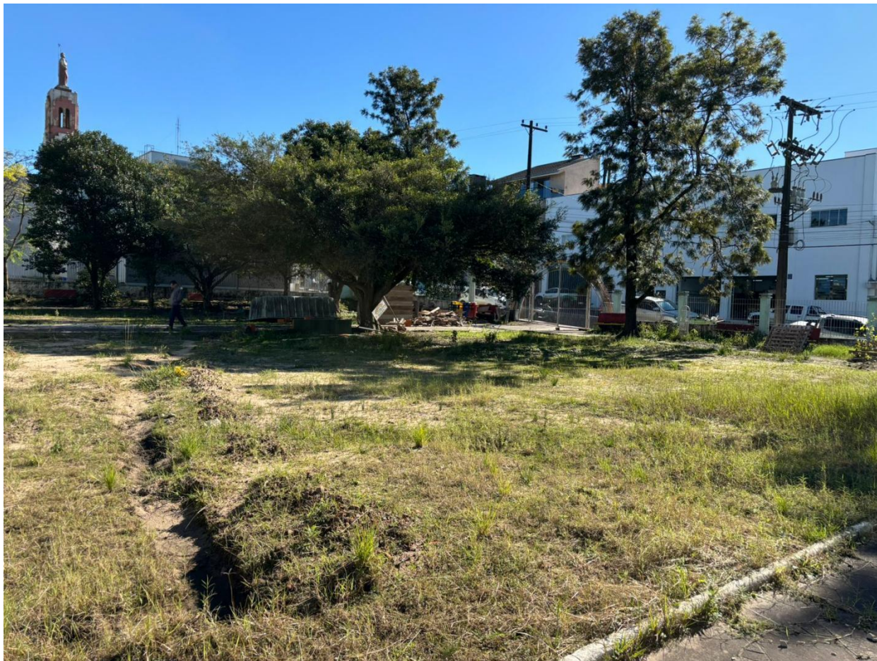
Imagem 02: Estado atual do Terreno